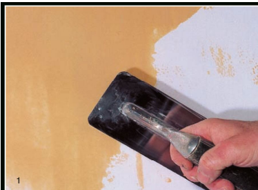
1 Выравниваем поверхность с помощью шпателя нанося Stucco Marmo чтоб выровнять поверхность