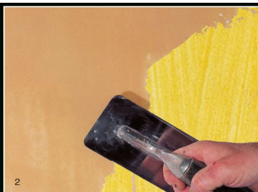
Наносим один слой Encausto Fiorentino чтоб выровнять поверхность