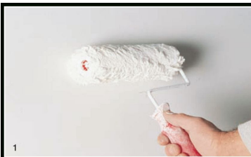
1 Наносим Genyus Special, один или два слоя

Нанесите Декору де Люкс кистью Декора, равномерно распределяя её на поверхности. Через 30-40 минут можно начинать «моделирование» Декору де Люкс шпателем для Декора, хаотично распределяя хлопья по поверхности.