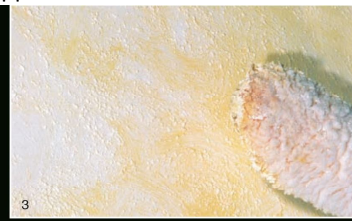
3 Спустя 15 минут пройти снова перчаткой или кистью Decora