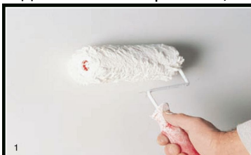
1 Наносим Genyus Special, один или два слоя

Размешивать Decora следует только вручную! Нанесение предполагает использование шерстяной рукавички или кисти для Decora, непрерывными круговыми или крестообразными движениями, с получением эффекта облаков. Примерно через 15 минут рекомендуется вновь пройти рукавичкой по отделанной поверхности, слегка вдавливая хлопья или использовать шпатель для Decora.